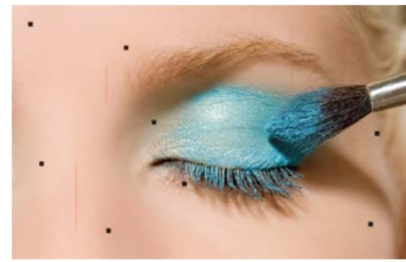
SMD > 50PPM

COB技術はSMDのピンとSMTリフロー工程が無いので、素子イモ半田のリスクが無く、安定性がより高い構造です。