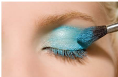
COB < 10PPM

PCBの表面全体がシリコンで覆われている為、表示面は防水（IP65）で、クリーニング可能